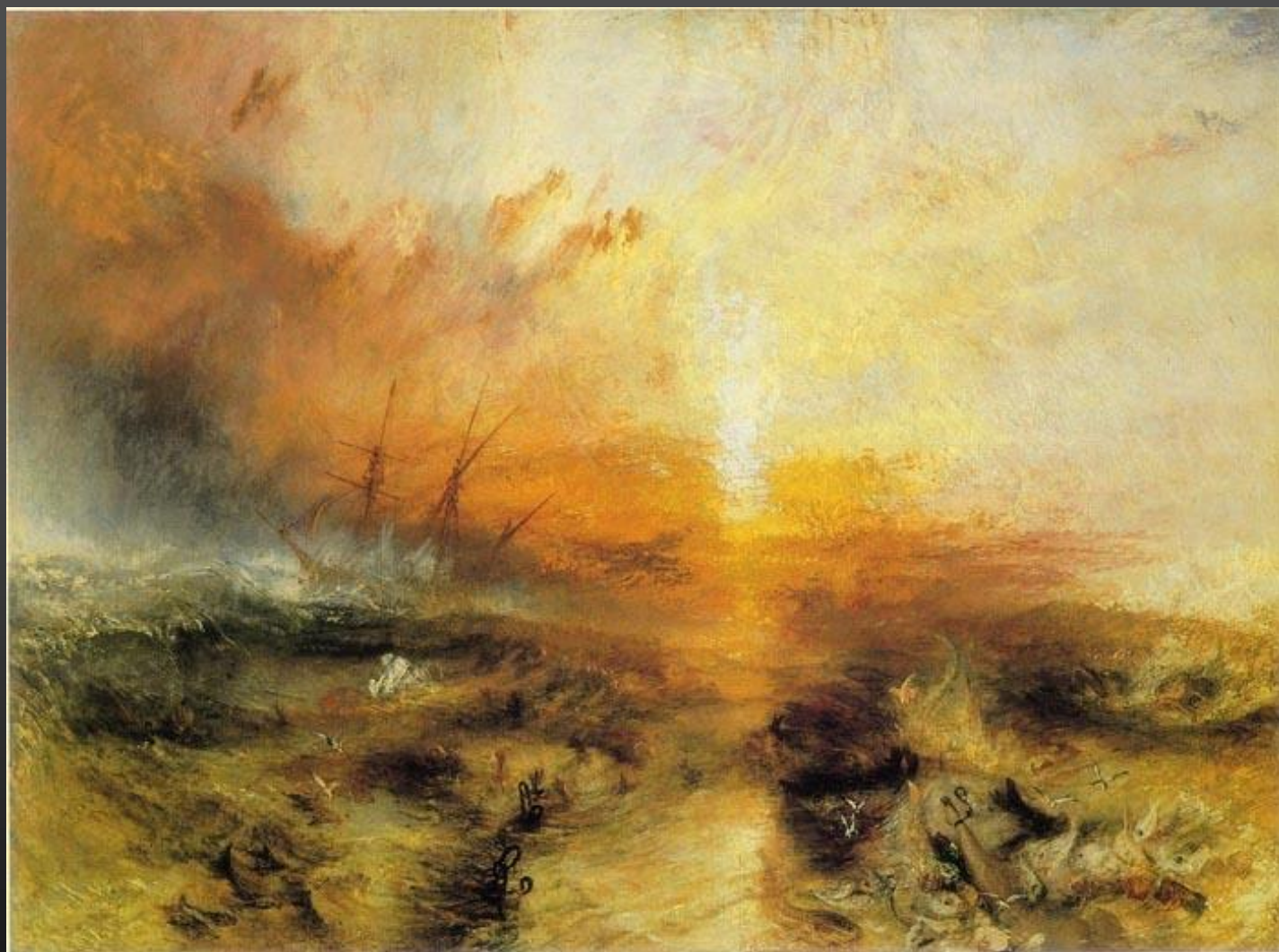
圖1-8 1840 泰納<奴隸船>暴風來臨之前，奴隸船將患病的奴隸丟下船的情形