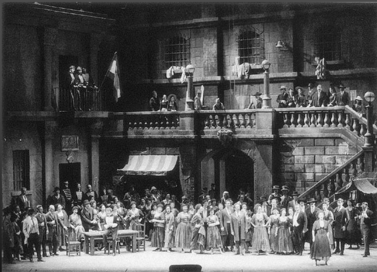
圖1-10 歌劇表現出的感染力來自於感情的抒發