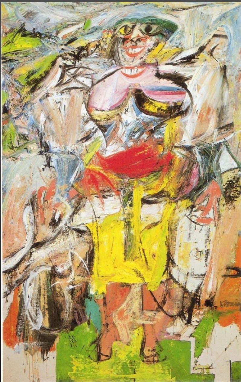
圖1-7 1952-1953 威廉·德庫寧 <女人與腳踏車>