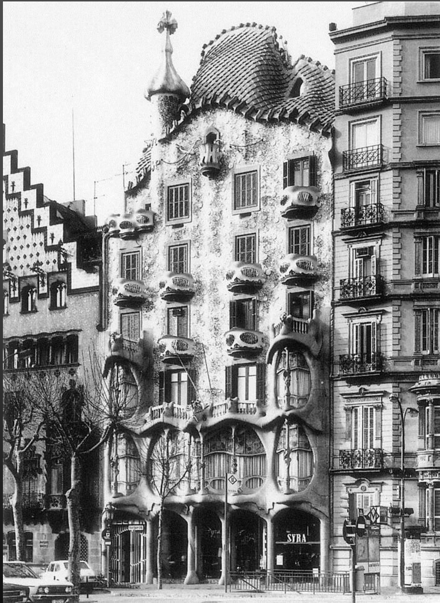
圖1-2 1904-1906 西班牙建築師 高第 <巴特里歐公寓>