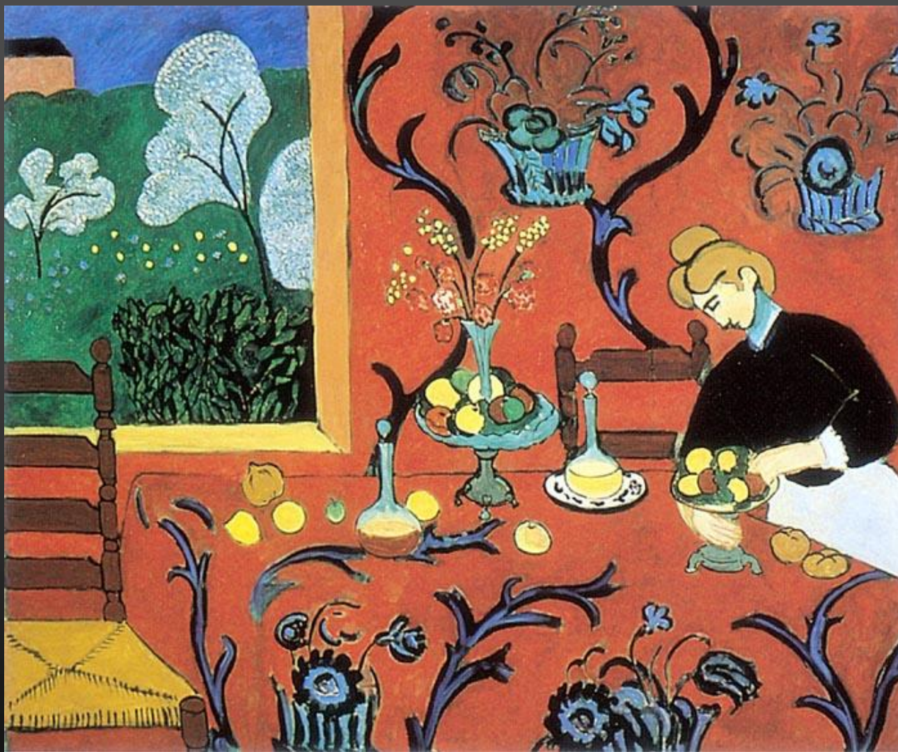
圖1-9 1908-1909 馬蒂斯 〈紅色的旋 律〉