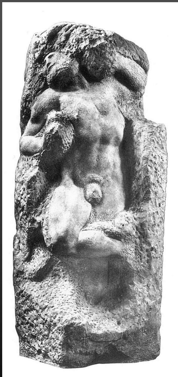
圖1-11 1530-1534 米開朗基羅 〈喚醒中的奴隸〉