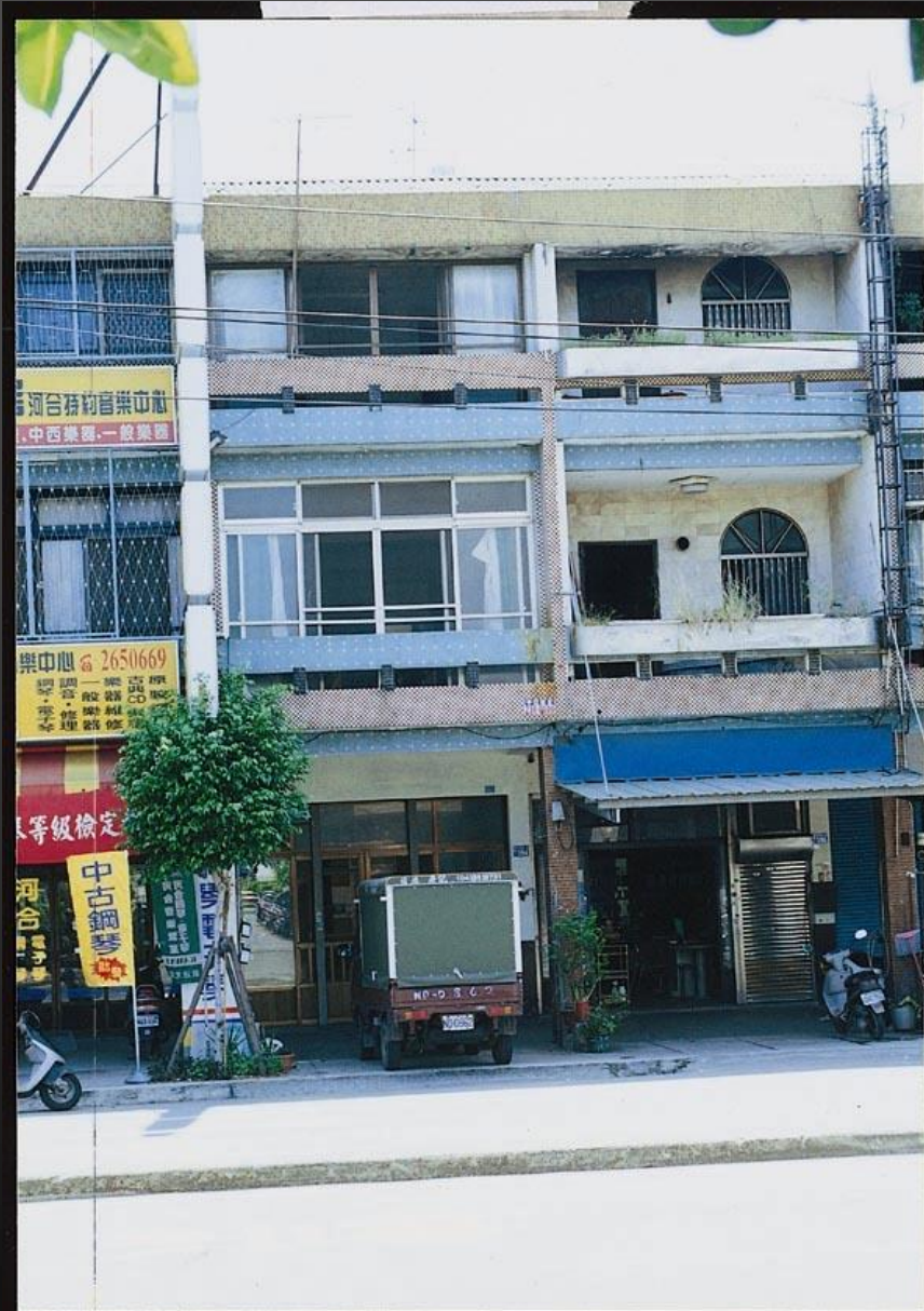
圖1-1 台灣一般住宅公寓