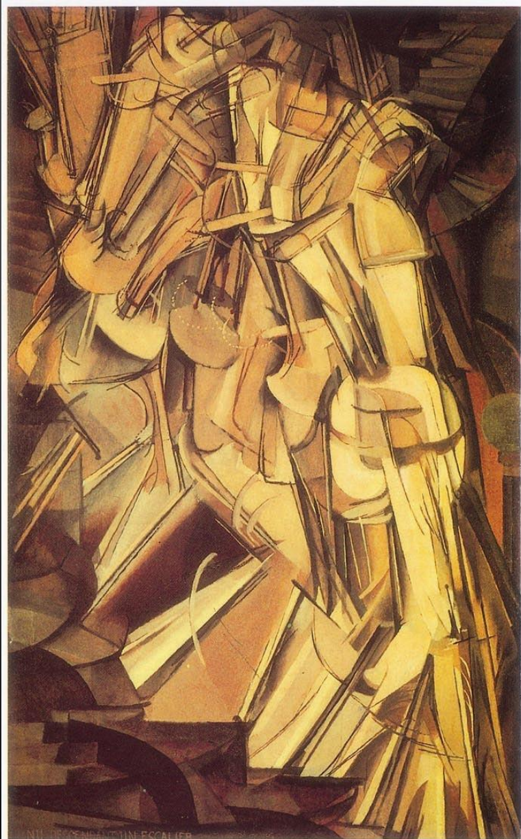
圖1-4 1912 馬歇爾·杜象<下樓梯的女人>利用攝影科學原理所表現的抽象繪畫